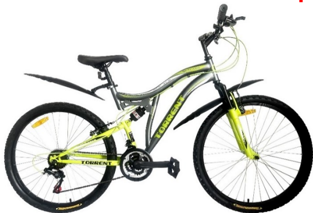
Матовый серый, зеленый